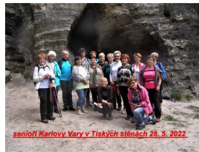
senioři Karlovy Vary v Tiských stěnách 26. 5. 2022

Sušici s muzeem Šumavy a Sušickým betlémem. Byli jsme na Svatohubertské mši ve Valči, v Chodové Plané v pivovaru a na Podivuhodné noci na zámku Bor u Tachova. V prosinci jsme byli na zámku v Tachově na koncertě 47 rozechvělých