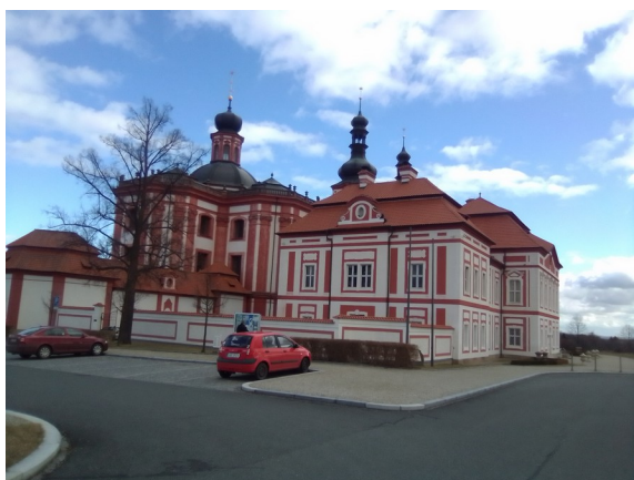
Mariánská Týnice, regionální muzeum severního Plzeňska