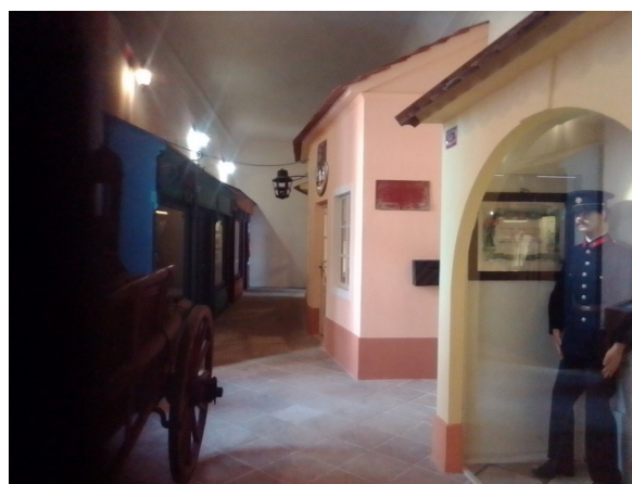
výstava v budově region severního Plzeňska 20 léta minulého století